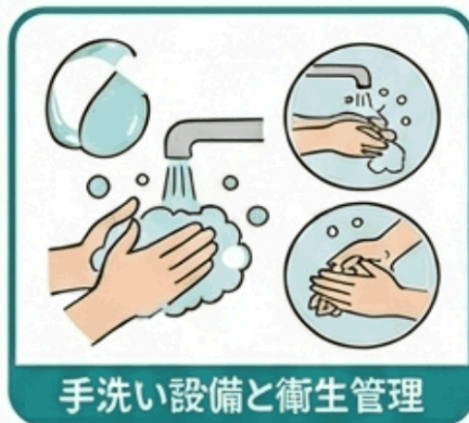
手洗い設備と衛生管理