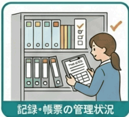
記録・帳票の管理状況