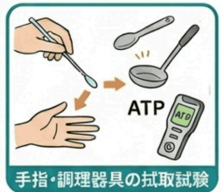
手指・調理器具の拭取試験