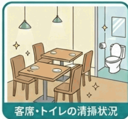
客席・トイレの清掃状況