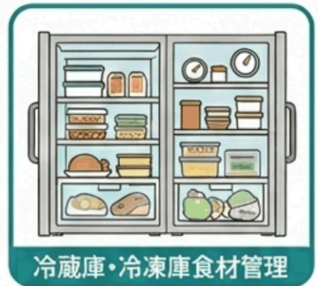
冷蔵庫・冷凍庫食材管理